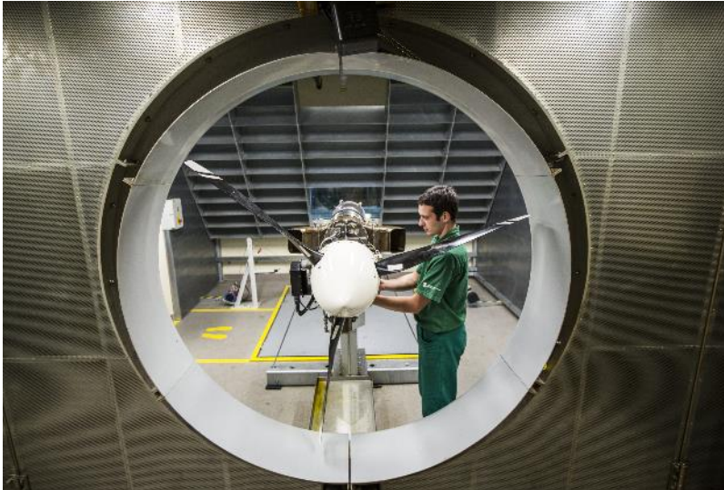
Obr.: Testování turbovrtulového motoru TJ 1P100 ve zkušebně letecké divize PBS

„Dnes představuje vývoj, testování a výroba zařízení pro letecký průmysl nejdůležitější část naší produkce. Začali jsme s pomocnými energetickými jednotkami a klimatizacemi pro letouny a vrtulníky, později jsme přidali proudové, turbovrtulové a turbodíselové motory rovněž vlastní konstrukce. Kromě vlastního vývoje a zkušebny disponujeme i širokým výrobním zázemím strojírnou a slévárnou, které nám poskytuje značnou soběstačnost,“ vysvětluje M. Kafka. V letošním roce se firmě dokonce podařilo představit s odstupem pouhých několika měsíců hned dva nové proudové motory.